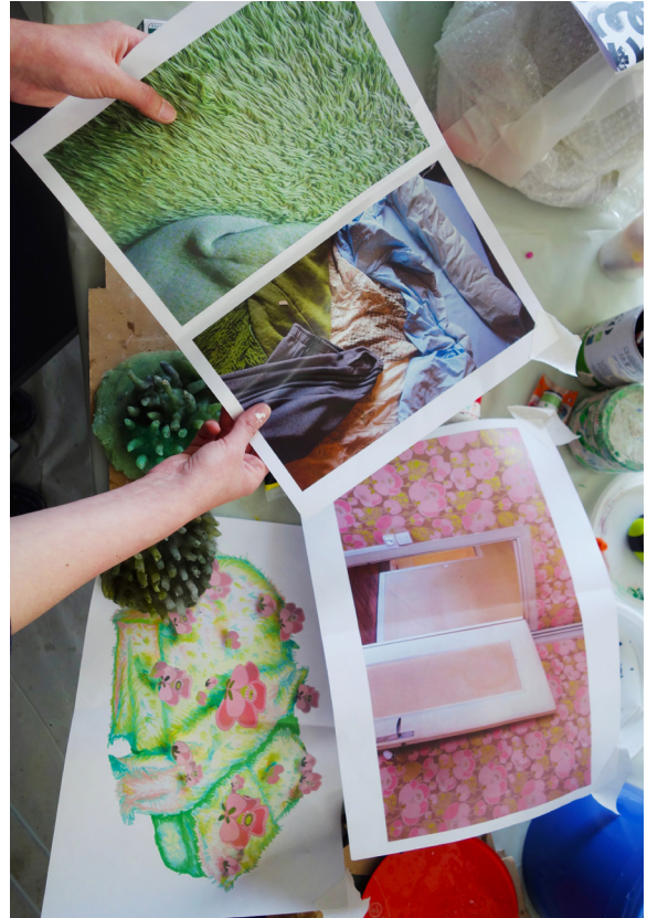
Atelier La Cyberrance - Romainville